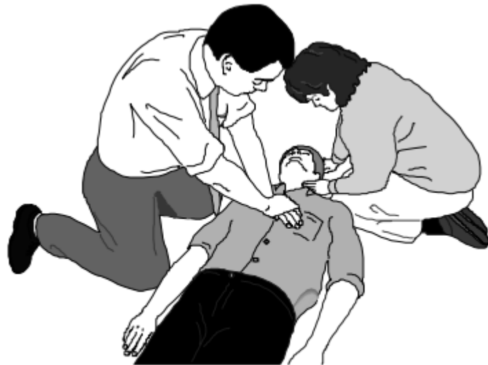
Bouche à bouche et massage cardiaque à deux

Dans les collectivités territoriales, les services concernés en priorité par cette formation sont les services techniques où les risques d'accident du travail sont importants, et les services en contact direct avec le public (restaurants scolaires, écoles, mairies, équipements sportifs...).